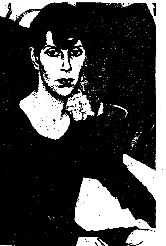
تصوير الفنان الألماني يوسيف يوسف شاميهين مؤرخا من الأخرج وأعداد فيلم (أغنية الوداع) الذي يتناول فيه فترات من حياة وفن وفكرات يوسيف شاميهين.

ارسم - مرة أخرى - كما يفعل الآخرون الذين ما زالوا يعترفون اليوم من كبار الرسامين، ولكن هذا لم يكن يعني بالنسبة إليه تقليد أساليب كبار الفنانين بل الالتزام بالموضوع والشكل والمحتوى الفني.